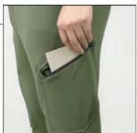
止水風ファスナー付