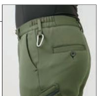
左右カラビナループ付 ※カラビナは付属しておりません