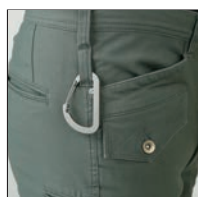
カラビナループ付 ※カラビナは付属しておりません