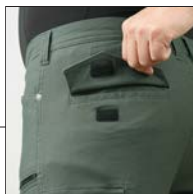
マジックテープ付 ポケット