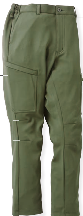
82 アーミーグリーン