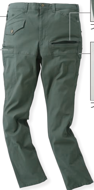
82 アーミーグリーン