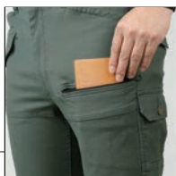
ファスナー付ポケット