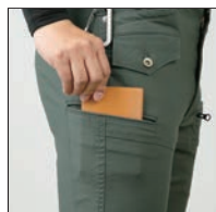
出し入れ簡単ポケット