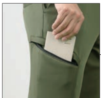
ファスナー付ポケット