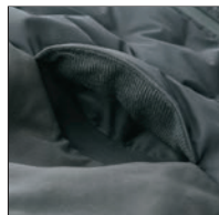
ポケットの内側にトリコット起毛を使用