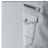
カーゴ右ファスナー ポケット