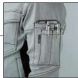
左袖ベン差し ポケット