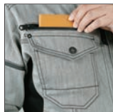
右胸ファスナー ポケット